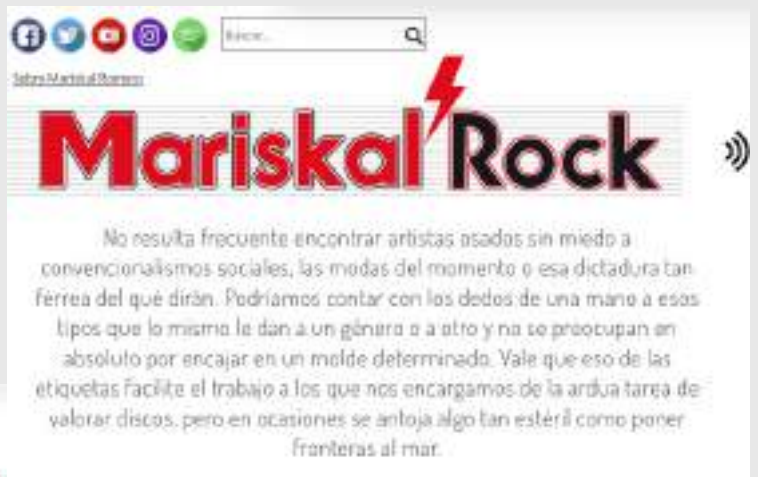
Reseña a cargo de Alfredo Villaescusa LEER completa AQUÍ